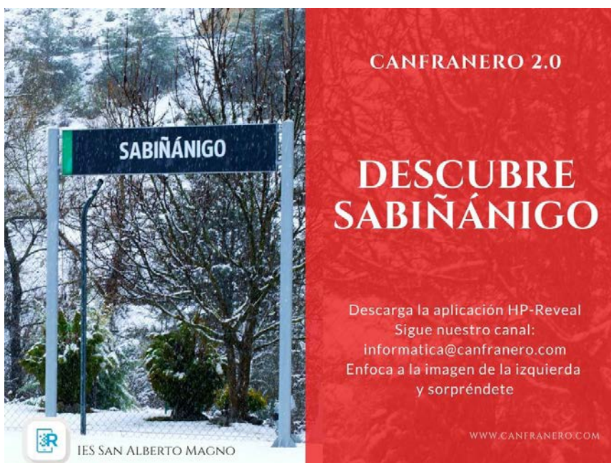
3 Carteles de Realidad Aumentada

Vídeos de Realidad Aumentada. Alumnos de los colegios de la zona han elaborado vídeos de difusión turística en los que presentan su localidad (qué comer, qué hacer, qué ver...). Se puede acceder a ellos a través de la aplicación de realidad aumentada HP Reveal que actúa como un código QR.