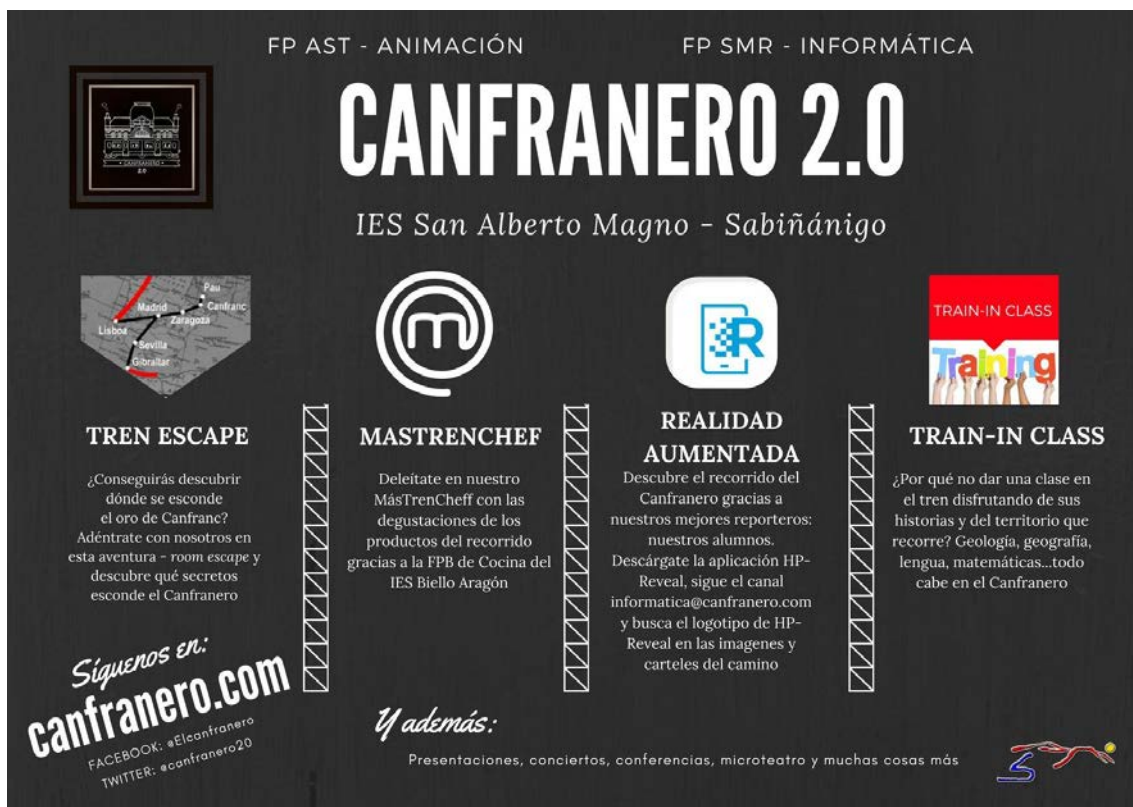
4 Cartel Canfrancero 2.0