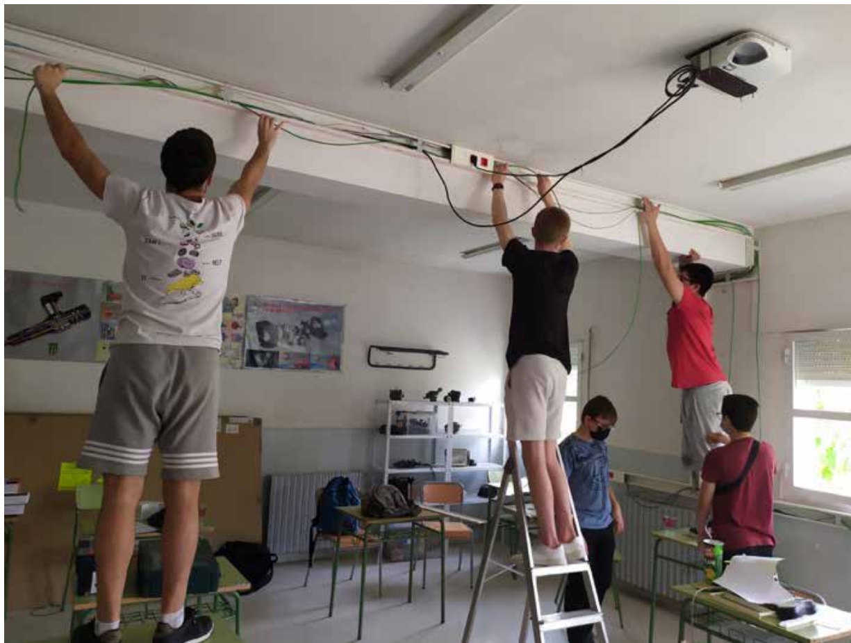
Imagen 4: Instalación del cableado estructurado del aula

FOL, que también formaban parte del reto, han estado presentes en todo el proyecto ya que, al estar sufragado por fondos europeos, se han creado materiales audiovisuales bilingües de cara a justificar el proyecto delante de la Comisión Europea, y al haber trabajado como una empresa real, se han realizado todos los trámites para actuar y constituirse como tales.