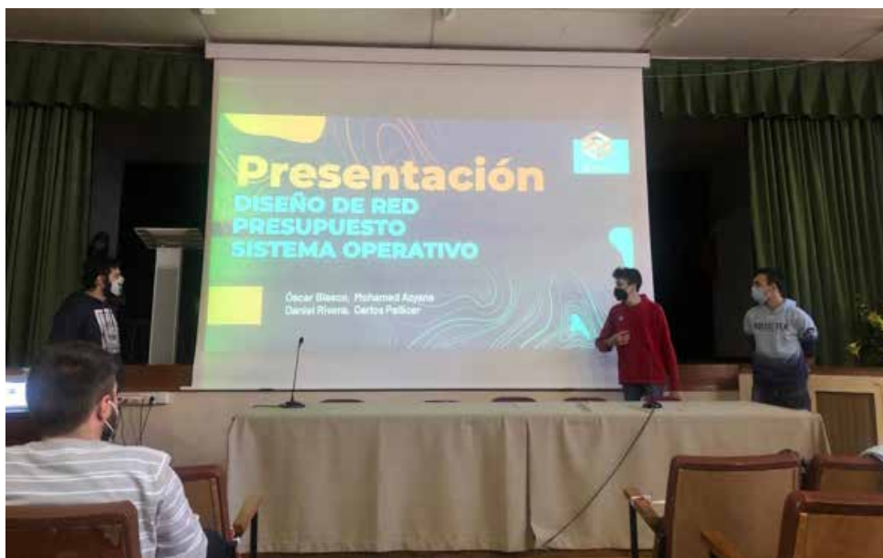
Imagen 2: Exposición de los diseños de aula

Con la filosofía en mente de trabajar siempre que fuera posible con proveedores locales y de la zona, nuestro alumnado se encargó de comprar todo aquel material necesario para la remodelación, desde el material necesario para la instalación de la red informática hasta los portátiles. Durante las tres siguientes semanas, se trabajó en la remodelación del aula con la solución elegida en pequeñas cuadrillas, dividiéndose el trabajo. Mientras unos realizaban el cableado de la clase otros preparaban los portátiles, pasando todos por todas las tareas.