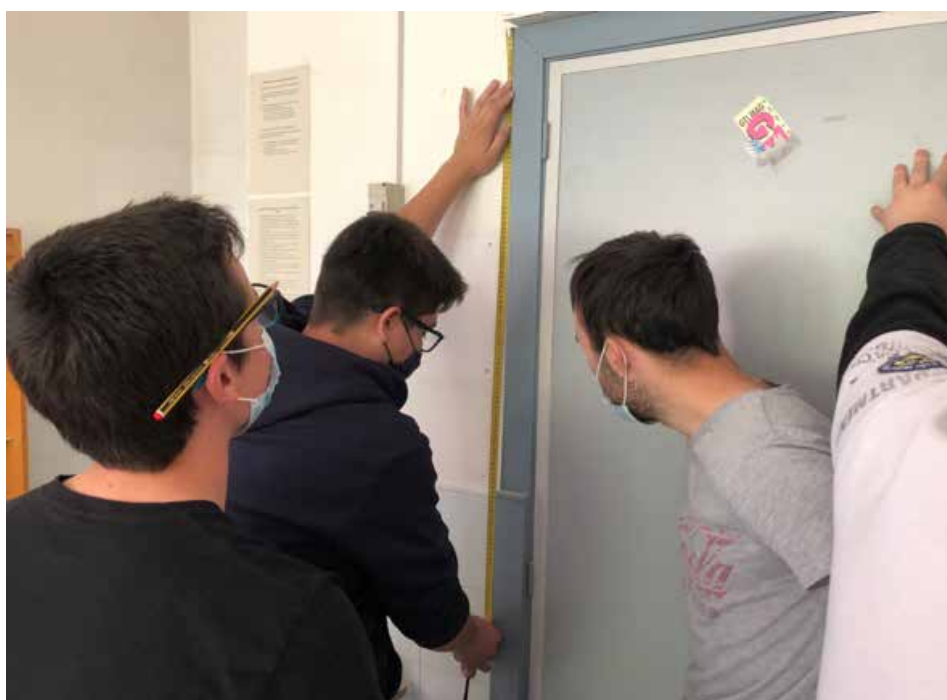
Imagen 3: Primeras mediciones en el aula de Formación Profesional Básica

Finalmente, se ha acabado la remodelación del aula habiendo realizado el cableado estructurado del aula, instalando 18 tomas de luz y red y preparando 10 portátiles con todos aquellos programas y aplicaciones requeridas. Además, los módulos de Inglés y