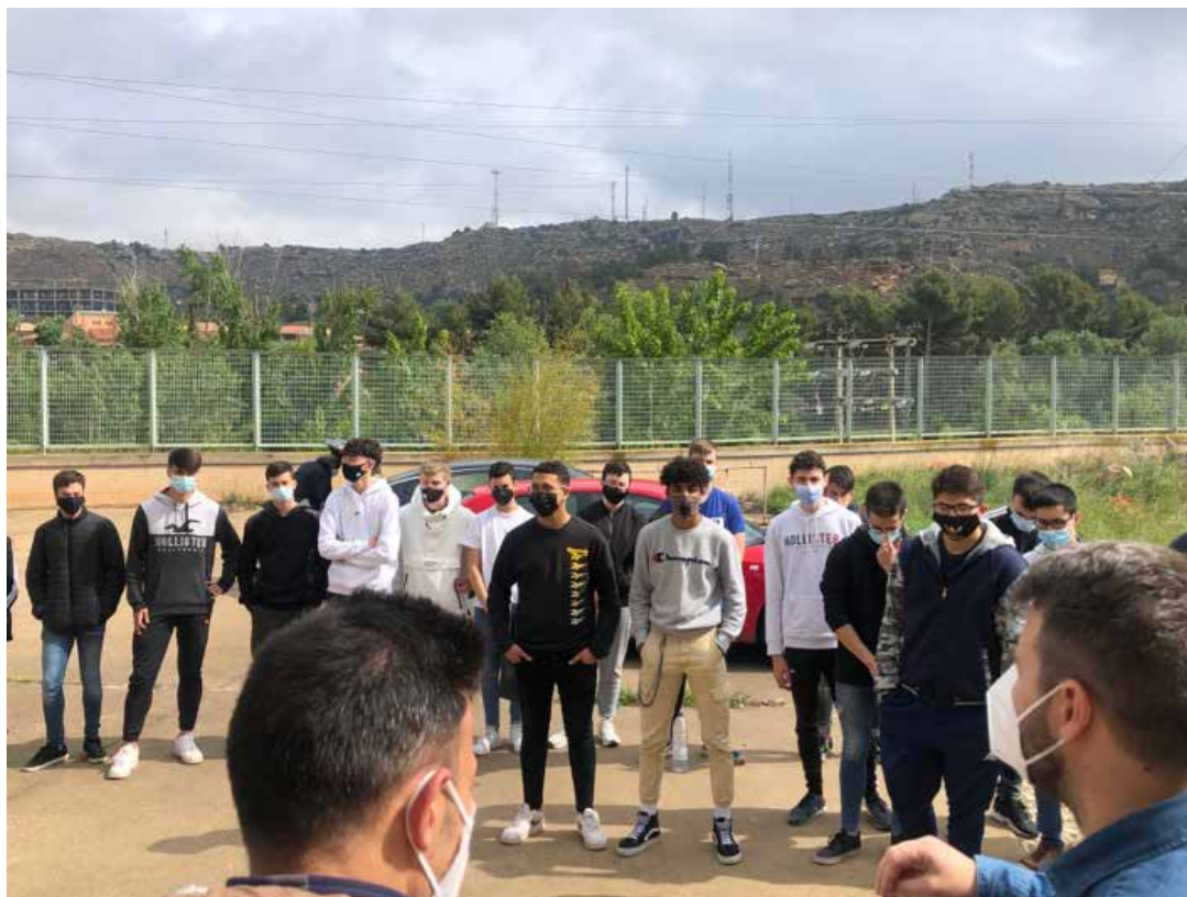
Imagen1: Presentación del reto a los dos grupos de estudiantes implicados

Las tres circunstancias que hemos expuesto en la presentación de este proyecto, el grupo de FPB con alumnado y profesorado descontento con sus medios y aula, el equipo docente de SMR buscando un reto en el que poner a trabajar a su alumnado y nuestro proyecto Erasmus apuntando en una línea de trabajo que unía a ambos grupos, dieron como resultado el proyecto que venimos a presentar: la rehabilitación del aula de 1º de FPB a cargo del alumnado de 1º de SMR.