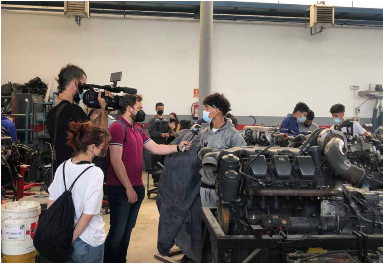
Imagen 5: Equipo de Aragón TV entrevistando a un alumno de FPB

Por otro lado, el alumnado de FPB también ha salido beneficiado de su participación en este proyecto, no solo como futuros usuarios del aula sino también en su autonomía y autoestima, habiendo tomado la iniciativa como clientes, siendo ellos los que marcaran agenda y habiéndose escuchado y tenido en cuenta todas sus opiniones y sugerencias. Su participación activa en la toma de decisiones sobre la remodelación del aula ha tenido un efecto muy beneficioso en ellos, sintiéndose parte del mismo y responsabilizándose de cuanto acontecía en su aula.